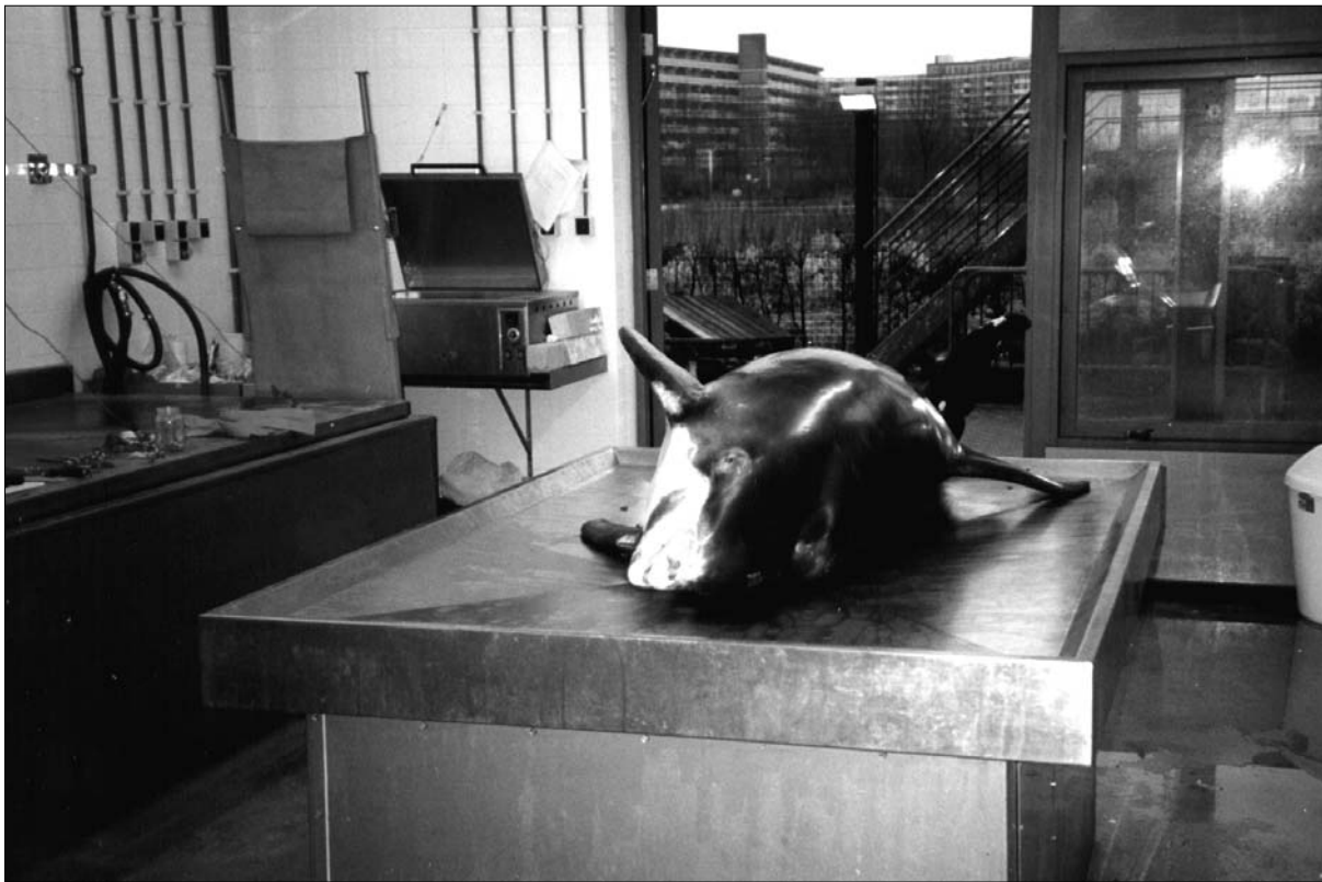
FIGUUR 4 DE SECTIETAFEL IN NATURALIS MET ZIJN LAATSTE SLACHTOFFER VAN DE EEUW: DE WITSNUITDOLFIJN VAN DEN HELDER.