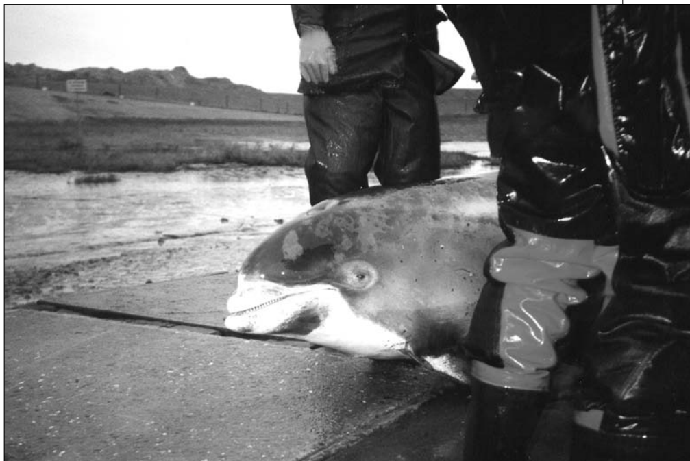
FIGUUR 3 DE DOLFIN DOET HAAR NAAM EER AAN: EEN PRACHTIGE WITTE SNUIT.