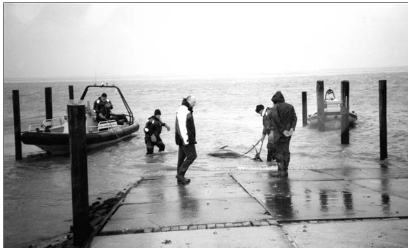
FIGUUR 2 DE WITSNUITDOLFIN WORDT AAN LAND GEBRACHT.

striede in m'n gezicht, het was bar weer. Eenmaal op het wad aangekomen trof ik Chris en de politiemensen aan. Chris zag eruit als een aangespoelde schipbreukeling met zijn reddingsvest en verregende hoofd (Figuur 1). Dat is de ware spirit! De dolfin, een prachtige volwassen witsnuitdolfijn lag vast in het slik en was niet vlot te krijgen. Maar na enig wrikken en de rugvin vrijgemaakt te hebben schoot ze los. Nu kon de dolfin over het wad de vaargeul ingetrokken worden en sleepte een politievaartuig het dier vervolgens naar een stenen trailerhelling langs de dijk, zo'n 500 meter verder. Na ongeveer een kwartier kwamen de politiebootjes aan bij de helling en kon de dolfin aan land worden gebracht (Figuur 2). Het was een prachtig volwassen (oud) vrouwelijk dier met een prachtige witte snuit, ze deed haar naam eer aan (Figuur 3). Het was half twaalf toen de dolfin in de vrachtwagen lag. Wat nu te doen?